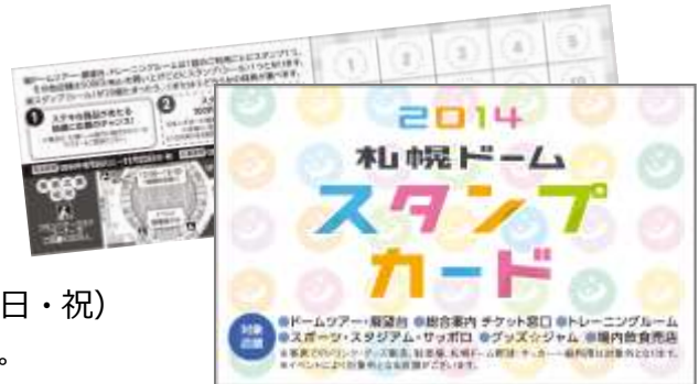
（スタンプカードのイメージ）